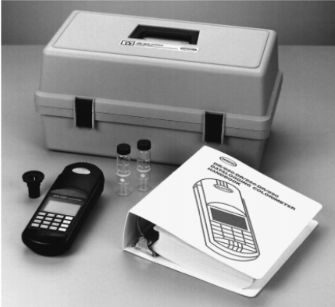
图 1 DR/800 系列色度仪标准包装*