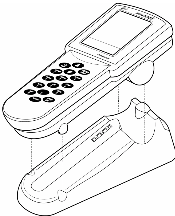
图 5 电源座